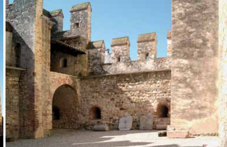
6. De tweede binnenplaats