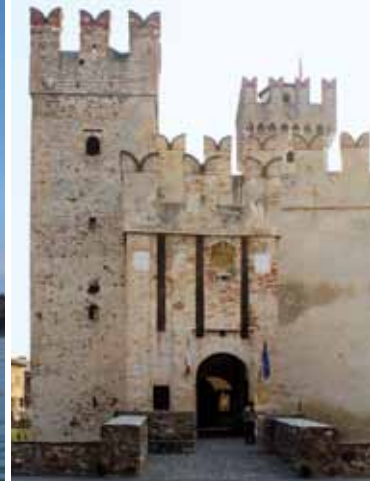
3. Toegang vanaf het Piazza Castello