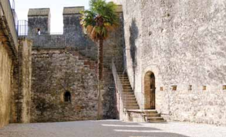
7. De binnenplaats van het dok

De binnenplaats van het dok (Afb. 7) fungeert als secundaire bescherming en wordt inderdaad omsloten door muren met daarop de zogenaamde "Ghibellijnse kantelen". Een trap voert naar de weergang die uitkijkt op het dok (Afb. 8) waarin de vloten van de familie Della Scala en de Venetiaanse vloten beschutting vonden en dat een uitzonderlijk voorbeeld van een vijftiende-eeuws versterkt havenbekken vormt. Het gaat namelijk om het oudste dok dat tegenwoordig bijna nog geheel intact is, net als het dok van het fort van Lazise, aan de Veronese kant van het Gardameer, dat zich vandaag ondergronds bevindt. Het dok heeft een onregelmatige trapeziumvorm en de helling van de externe muur kan een maatregel geweest zijn om de waterspiegel binnenin het bekken te beschermen tegen de Tramontana, de uit het noorden blazende wind, of "pelèr". Er lopen twee weergangen over de drie zijden: de bovenste ter verdediging van de milities en de onderste daarentegen voor het aanmeren van de boten. Het interne bekken van het dok - dat door de opeenhoping van puin in de loop der eeuwen ondergronds kwam te liggen en gedurende de gehele negentiende eeuw een begaanbare binnenplaats was - werd in 1919 uitgegraven om opnieuw het water van het meer te ontvangen. In 2018, na een restauratie waarbij ook een trap in de noordoostelijke toren gerealiseerd werd, is het dok dan eindelijk opengesteld voor het publiek.