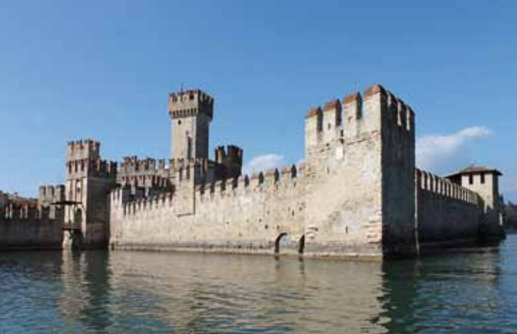
1. Aanzicht vanaf het meer