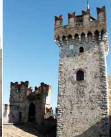
4. De donjon