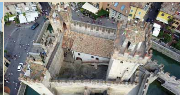
5. De centrale binnenplaats

De centrale binnenplaats , vroeger gebruikt als plein voor militaire oefeningen, wordt goed beschermd door de drie torens en de donjon . (Afb. 4) Deze laatste, oorspronkelijk de woning van de kasteelheer, wordt geflankeerd door de slaapzalen voor soldaten, cassero genoemd. De twee gebouwen zijn nauw met elkaar verbonden om de troepen in staat te stellen zich snel naar de weergang, of omloop, te begeven. (Afb. 5)