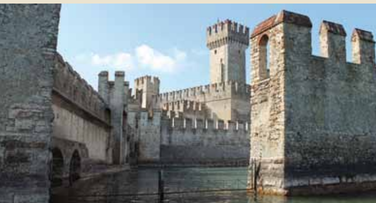
2. Toegang tot het dok vanaf het meer

Via de poort, die vroeger ook een valhek had, wordt toegang verkregen tot de zuilengalerij met de ticketverkoop, didactische panelen en drie houten prauwen uit de hoge middeleeuwen die in de rivier de Oglio gevonden zijn door een team archeologen van het Centrum voor Onderwaterarcheologie (STAS) dat jarenlang in het kasteel gevestigd was.