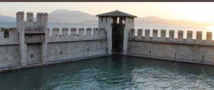
8. Het dok

De binnenplaats van het dok (Afb. 7) fungeert als secundaire bescherming en wordt inderdaad omsloten door muren met daarop de zogenaamde "Ghibellijnse kantelen". Een trap voert naar de weergang die uitkijkt op het dok (Afb. 8) waarin de vloten van de familie Della Scala en de Venetiaanse vloten beschutting vonden en dat een uitzonderlijk voorbeeld van een vijftiende-eeuws versterkt havenbekken vormt. Het gaat namelijk om het oudste dok dat tegenwoordig bijna nog geheel intact is, net als het dok van het fort van Lazise, aan de Veronese kant van het Gardameer, dat zich vandaag ondergronds bevindt. Het dok heeft een onregelmatige trapeziumvorm en de helling van de externe muur kan een maatregel geweest zijn om de waterspiegel binnenin het bekken te beschermen tegen de Tramontana, de uit het noorden blazende wind, of "pelèr". Er lopen twee weergangen over de drie zijden: de bovenste ter verdediging van de milities en de onderste daarentegen voor het aanmeren van de boten. Het interne bekken van het dok - dat door de opeenhoping van puin in de loop der eeuwen ondergronds kwam te liggen en gedurende de gehele negentiende eeuw een begaanbare binnenplaats was - werd in 1919 uitgegraven om opnieuw het water van het meer te ontvangen. In 2018, na een restauratie waarbij ook een trap in de noordoostelijke toren gerealiseerd werd, is het dok dan eindelijk opengesteld voor het publiek.