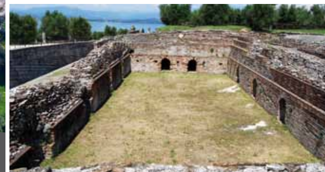
3. Криптопортик 4. Бассейн

Только после государственного приобретения местности в период с 1947 по 1949 год, были проведены обширные исследования, которые привели к изданию (1956) первого путеводителя о комплексе, с точным толкованием роскошной виллы римской эпохи. Более поздние исследования позволили уточнить хронологию виллы, построенную в эпоху Августа (последние десятилетия I века до н.э. начало I н.э.) и заброшенную между III и IV веками н.э., подтверждая, что сегодняшняя структура была возведена по единому проекту, определяющему направление и пространственное распределение, в соответствии с точно выраженными критериями аксиальности и симметрии.