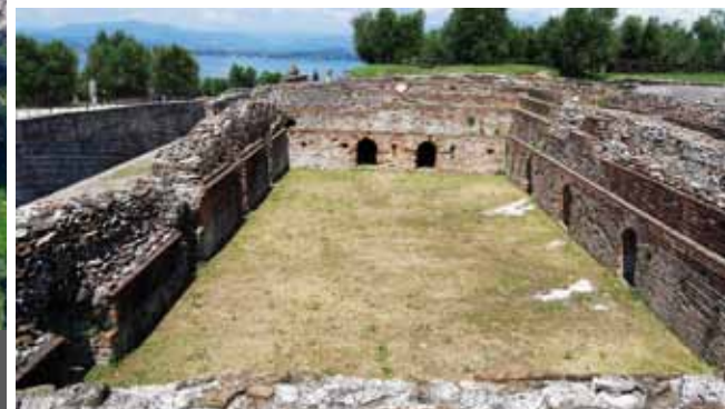
3. 地道 4. 游泳池

最近的调查研究清楚地展现了别墅的年代表，建于奥古斯都时期（公元前一世纪的最后几十年至公元一世纪的开始），在公元三和四世纪之间被遗弃，研究证实当前建筑是依据准确的轴向和对称性设计确定方向及空间分布的项目。