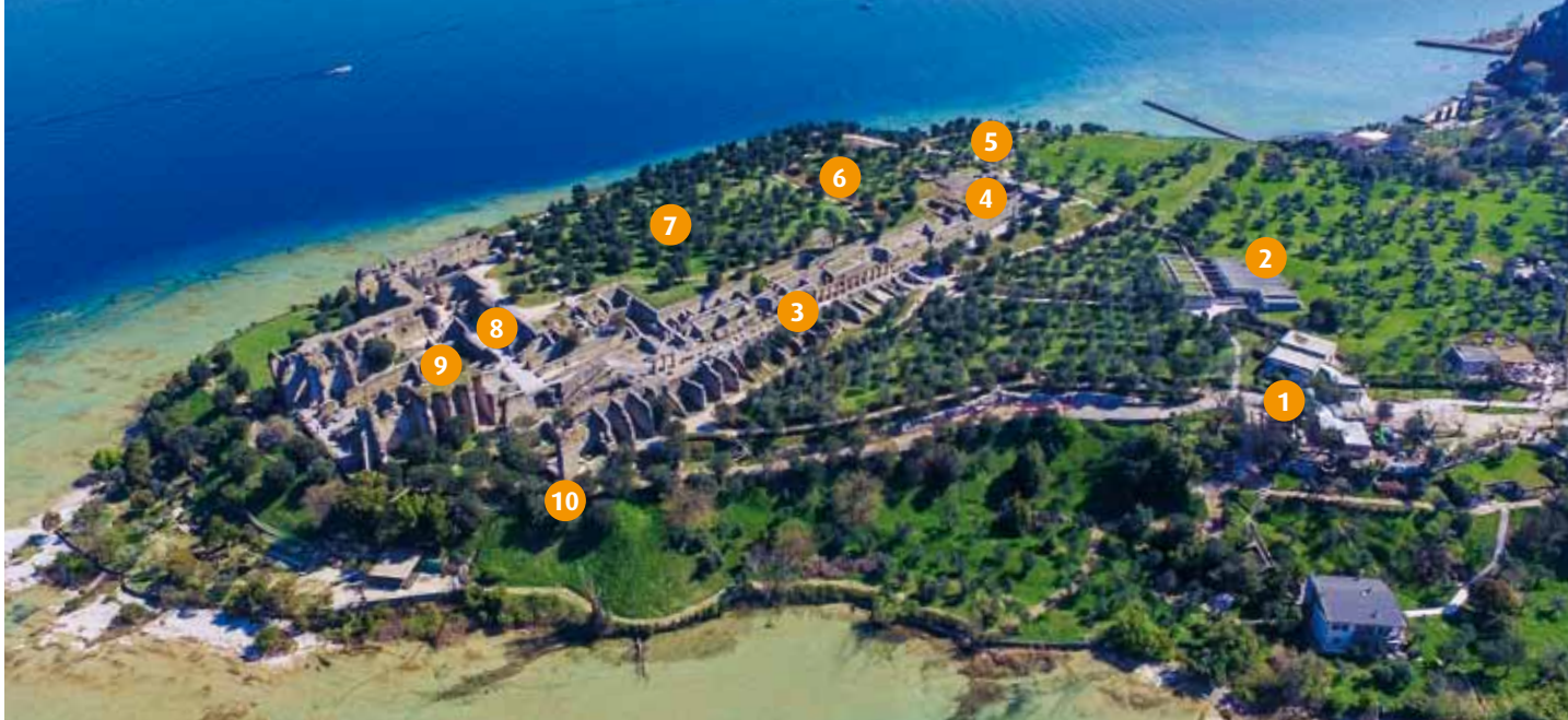
卡图洛洞穴的考古区域