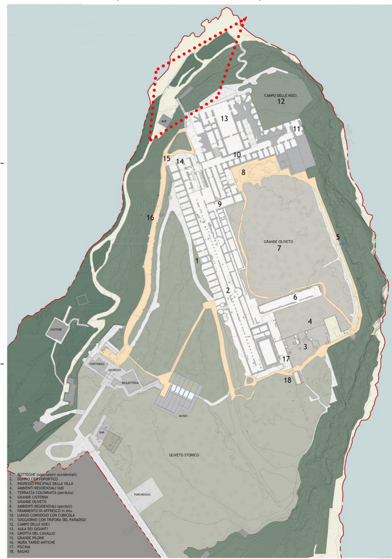
PLANIMETRIA GENERALE GROTTE DI CATULLO