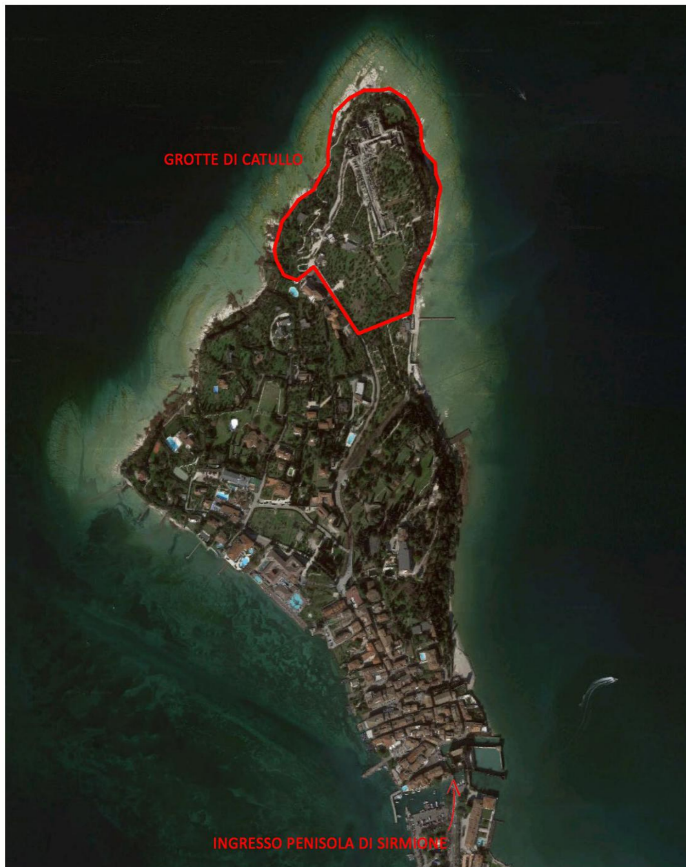
ORTOFOTO PENISOLA DI SIRMIONE