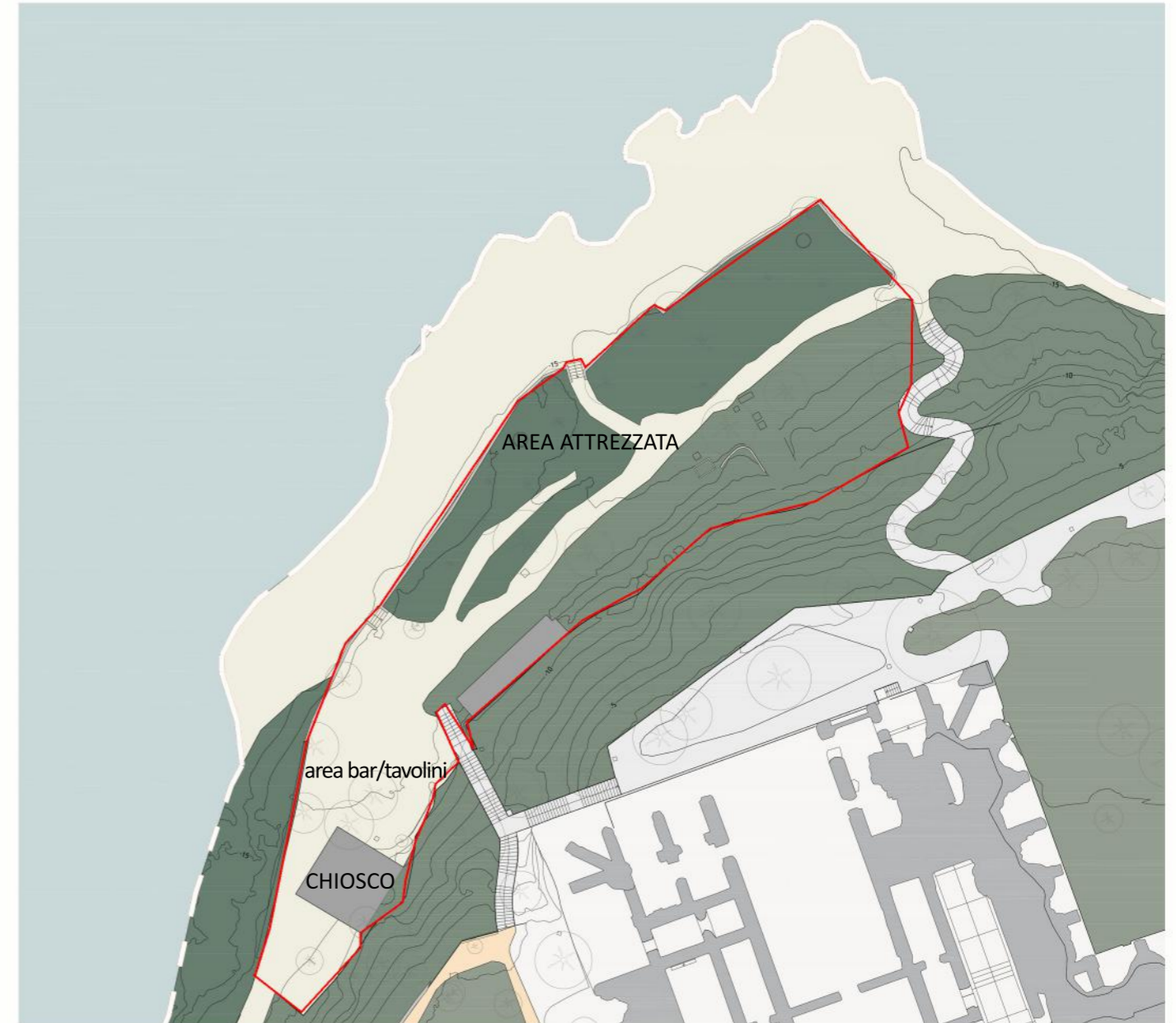
PLANIMETRIA CHIOSCO E AREA ATTREZZATA DELLE GROTTI DI CATULLO